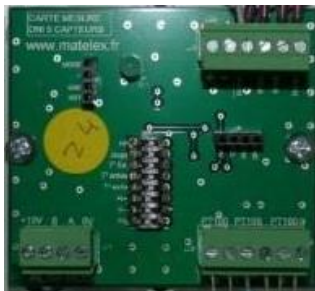
Carte Mesure V1

Il sera nécessaire d'inverser les fils A & B du bus RS485 sur le connecteur de la carte.